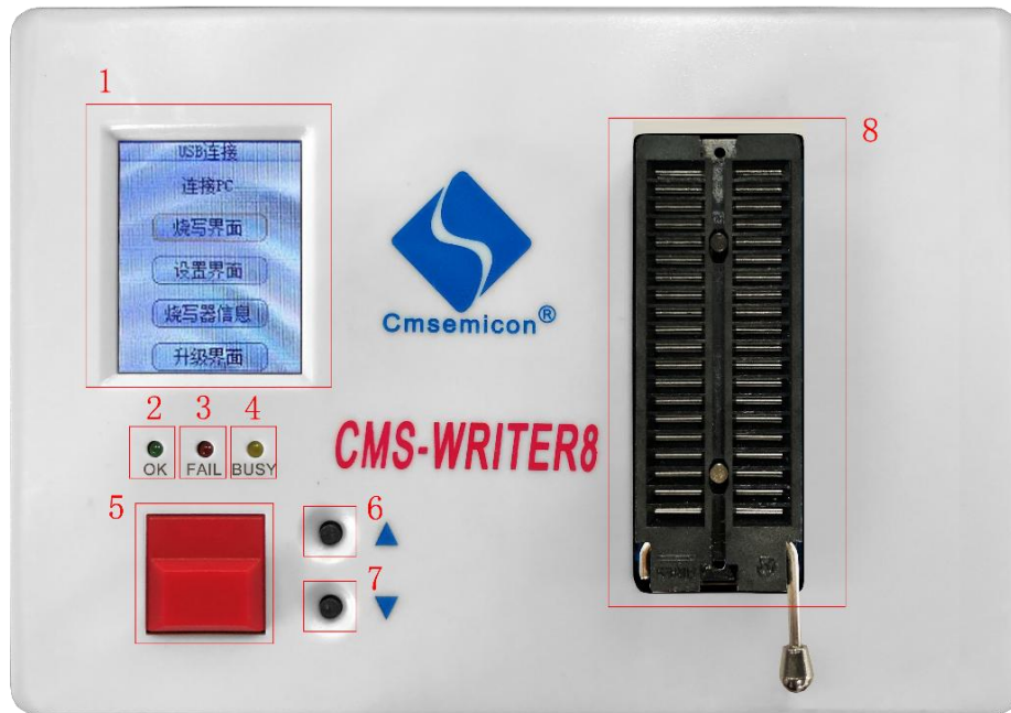
图 1-1：烧写器下位机外观

此注意事项手册适用于软件 CMS_WriterPro，烧写器使用 CMS-WRITER V8。 CMS_WriterPro 软件和 CMS-WRITER V8 烧写器统称为 CMS_WriterPro 烧写工具。